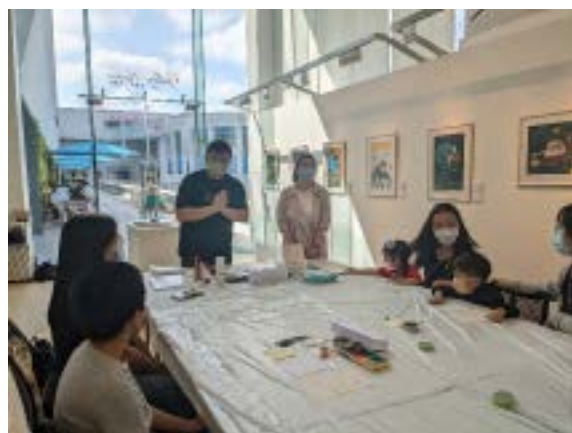
與廚尊合辦的Little White x Mr. Men Little Miss藝術工作坊