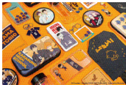
於台灣的《排球少年！！》快閃店