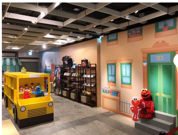
於台灣的《芝麻街》快閃店