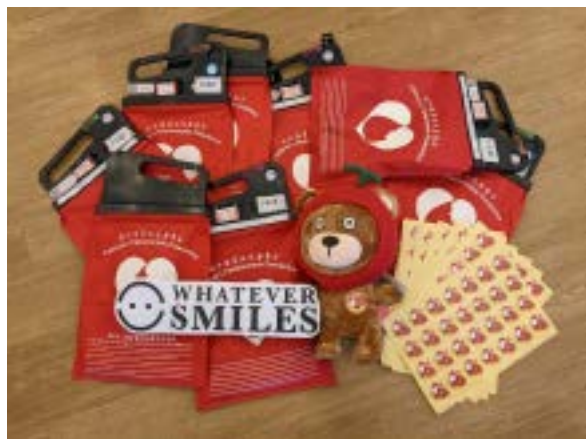
LYCHEE & FRIENDS x 地中海貧血兒童基金賣旗日