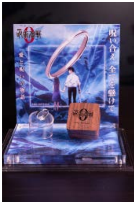
於香港LCX的《咒術迴戰》快閃店