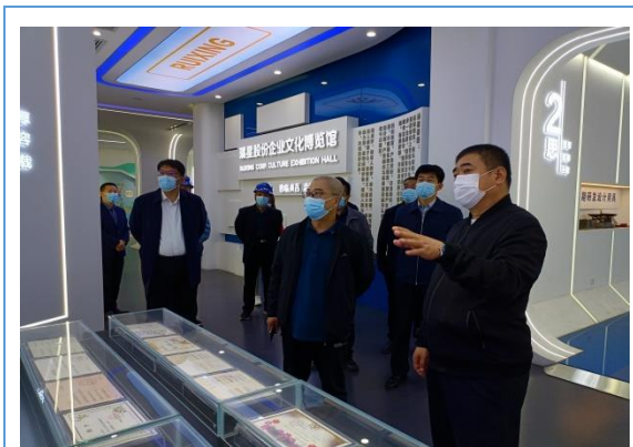
省领导来公司参观指导工作。