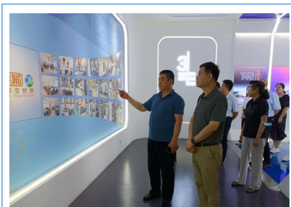
质量奖评审专家组来公司考察。