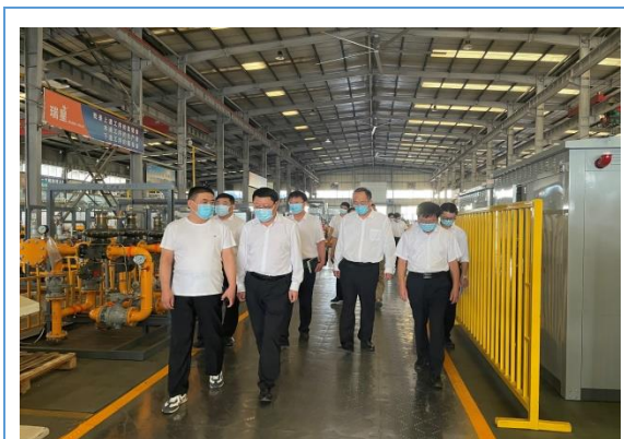
县领导来公司参观指导工作。