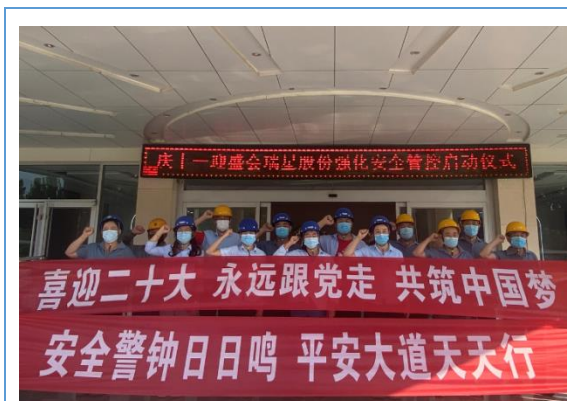
举办庆十一迎盛会瑞星股份强化安全管控启动仪式。