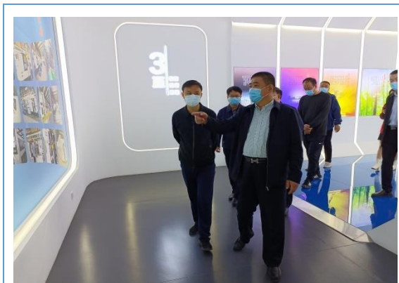
市领导来公司参观指导工作。