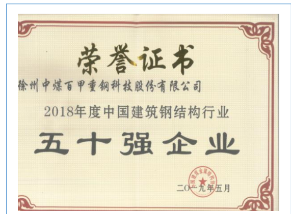
公司被评为中国钢结构行业五十强企业