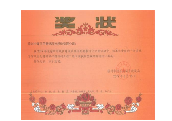
公司荣获轻型钢结构设计一等奖

授权境外专利：印度尼西亚专利“超大跨度网架拱棚储料仓施工工艺” PCT 国际申请号：PCT/CN2012/079828 已收到印度尼西亚专利授权通知书。