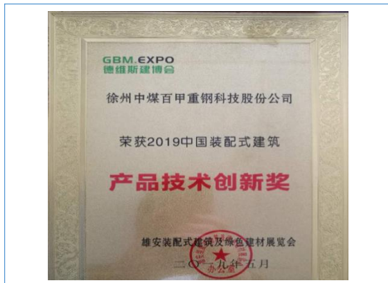
公司荣获 2019 中国装配式建筑产品 技术创新奖