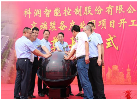
2020年5月，公司“高端装备产业园”项目开工奠基仪式。