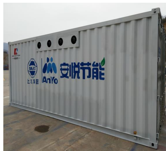
2020年12月，公司智能型光伏（风力）发电专用预装式变电站被浙江省经济和信息化厅认定为2020年度“浙江制造精品”。