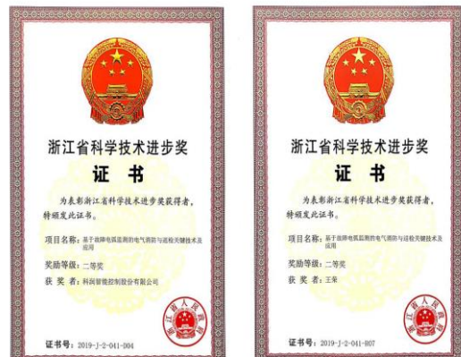
2020年6月，公司荣获“2019年浙江省科技进步二等奖”。