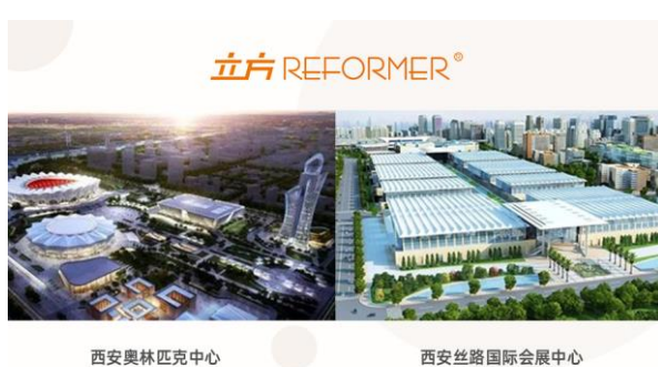
西安奥林匹克中心

2019年11月，公司成功中标贵阳市智慧停车公共信息服务平台系统建设项目，进一步推进城市级智慧停车平台及停车设施建设。