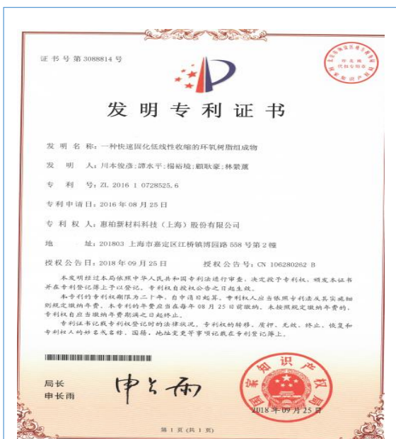
2018年9月，公司取得1项发明专利、3项实用新型专利证书。