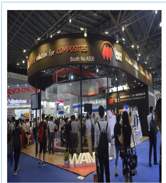
2018年9月，公司参加“第24届中国国际复合材料工业技术展览会”。