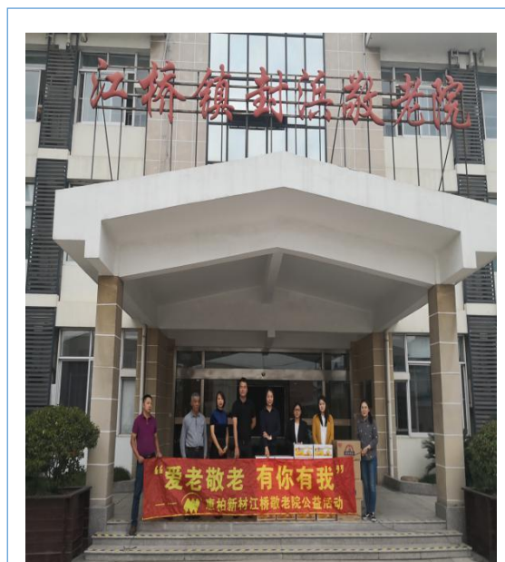
2018年10月，公司参加江桥镇封浜敬老院公益活动。