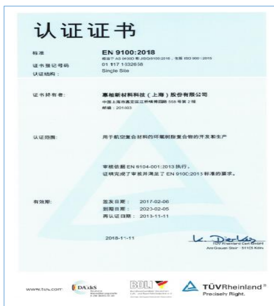
2018年11月，公司取EN9100:2018航空、航天质量管理体系证书。