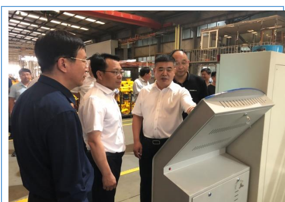
8 月 14 日，县领导就“三创四建”活动开展情况，到我公司调研。