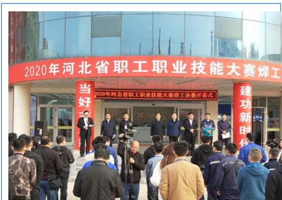
10 月 27 日，河北省职工职业技能大赛焊工决赛在我公司举行，开幕式上领导致辞