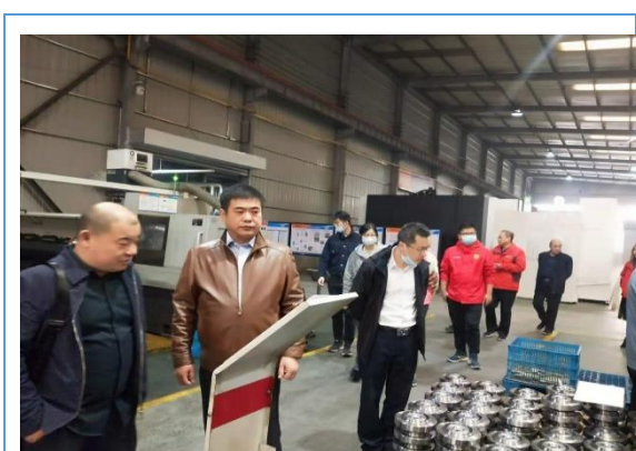
11 月 11 日武汉市天然气来我公司考察