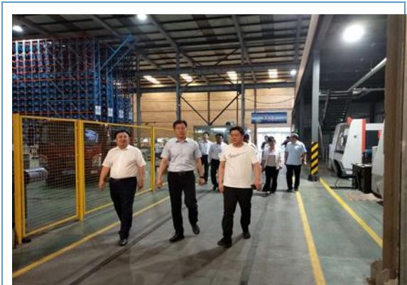
9 月 9 日市工商联领导来我公司参观指导工作