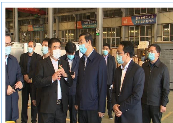
10 月市领导来我公司参观指导工作