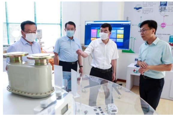
威海市市委书记张海波到公司调研