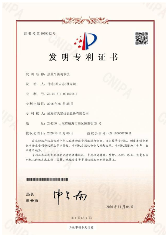
取得热量平衡调节法发明专利证书