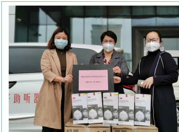
公司携手区政府共同抗疫 捐赠防护物资保地区平安