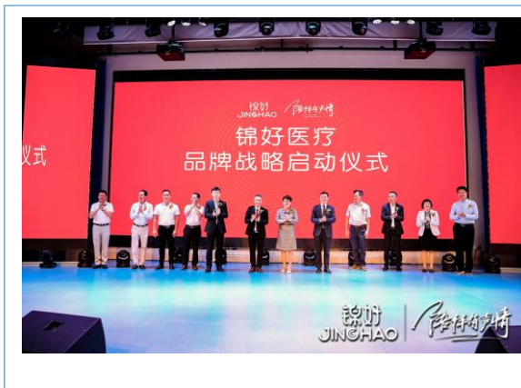
2020 年公司品牌战略启动 仪式暨新品发布会成功举办