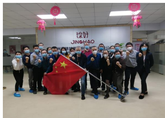
公司积极启动亮剑计划 复工复产促全年业绩增长