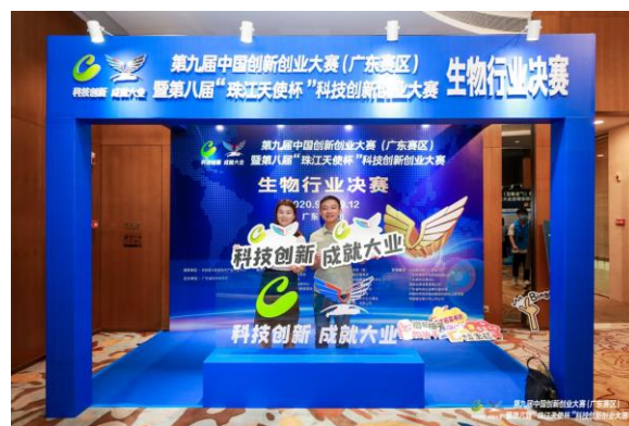
公司获 2020 年中国创新 创业大赛惠州赛区二等奖