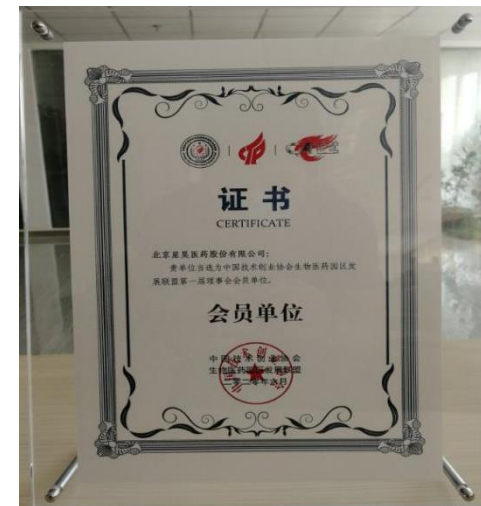
星昊医药当选为中国技术创业协会生物医药园区发展联盟第一届理事会会员单位。