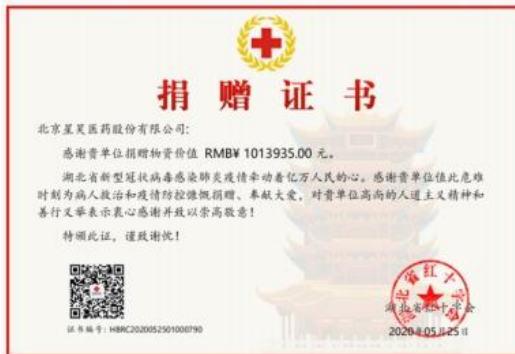
星昊医药向湖北省捐赠药品，湖北省红十字会颁发的《捐赠证书》。