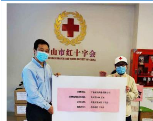
广东星昊向中山市红十字会捐赠人民币 100 万元用于疫情防控。

北京星昊被工业和信息化部评为第二批专精特新“小巨人”企业。 北京星昊再次取得高新技术企业证书。