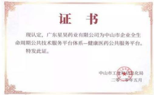
广东星昊的“健康医药公共服务平台”被认定为生物医药板块的“全生命周期公共技术服务平台”。

北京星昊被工业和信息化部评为第二批专精特新“小巨人”企业。 北京星昊再次取得高新技术企业证书。