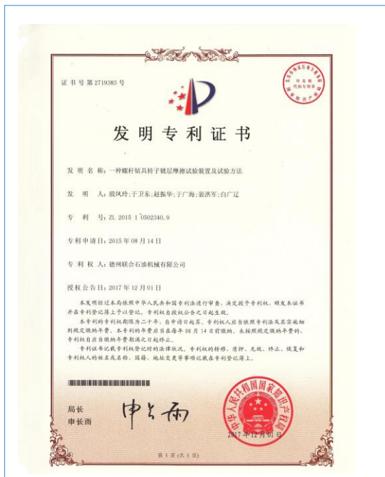
2017年12月1日，公司取得发明专利“一种螺杆钻具转子镀层摩擦试验装置及试验方法”