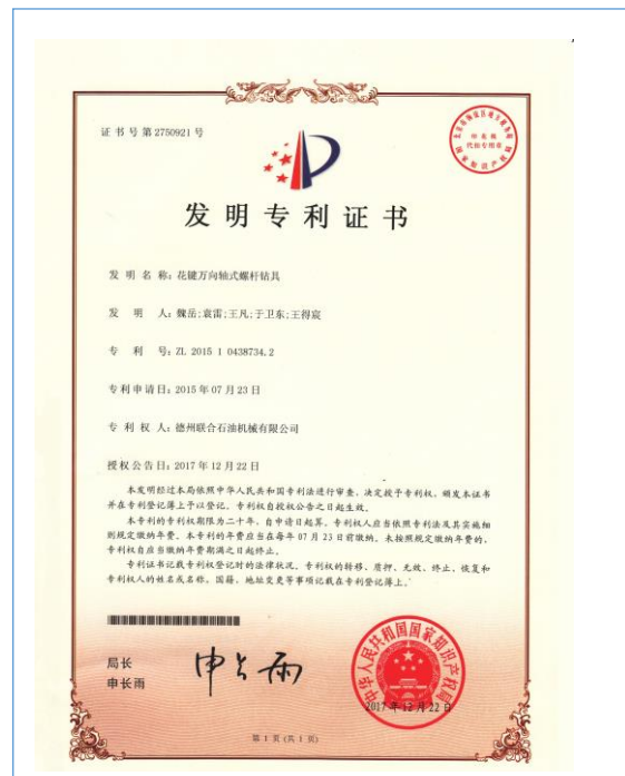
2017年12月22日，公司取得发明专利“花键万向轴式螺杆钻具”