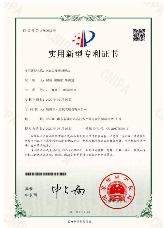
取得 PCB 天线灌封模块实用新型专利证书