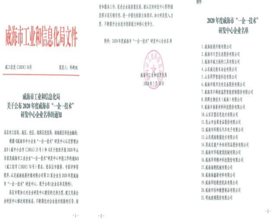
公司威海市“一企一技术”研发中心获批建设