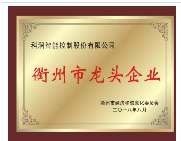
2018年8月22日，公司荣获“衢州市工业龙头企业”称号