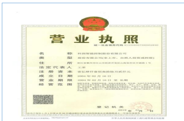
2018年3月2日，公司名称变更为“科润智能控制股份有限公司”