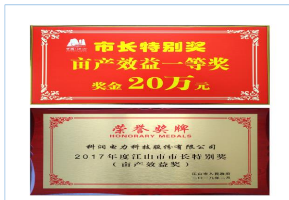
2018年2月23日，公司荣获江山市市长特别奖