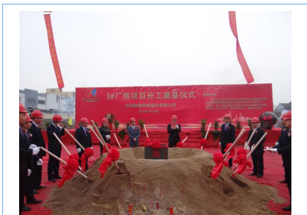
2018年3月18日，公司举行3号厂房奠基仪式