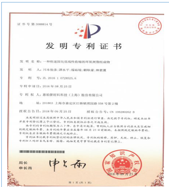
2018年9月，公司取得1项发明专利、3项实用新型专利证书。