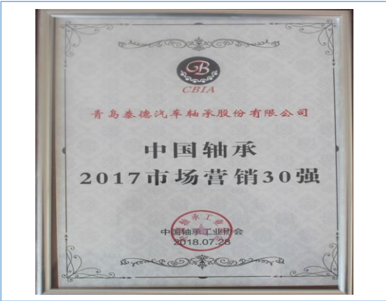
3、2018 年 7 月，公司被中国轴承工业协会认定为“中国轴承 2017 年度市场营销 30 强”