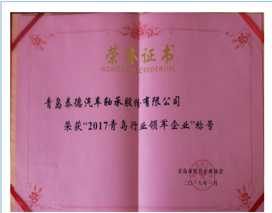
1、2018 年 1 月获得青岛市民营企业协会颁发的“2017 年青岛行业领军企业”称号。