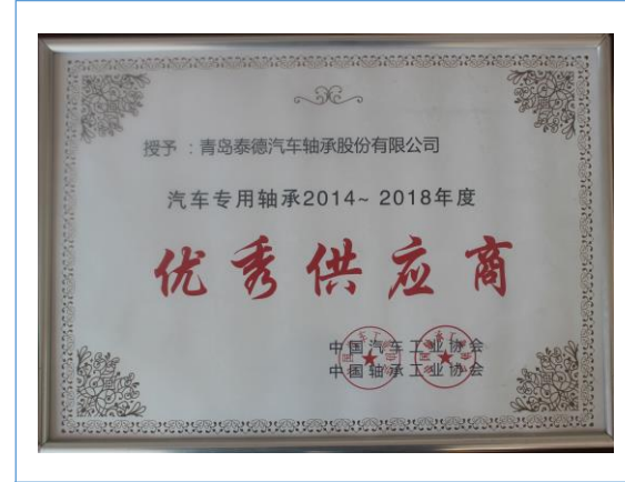
4、2018 年 7 月，公司被中国汽车工业协会及中国轴承工业协会认定为“汽车专用轴承 2014-2018 年度优秀供应商”