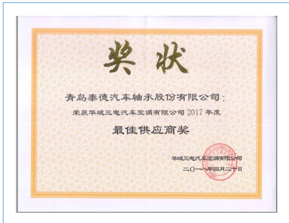
2、2018 年 4 月，公司获得华域三电汽车空调有限公司 2017 年度最佳供应商奖。