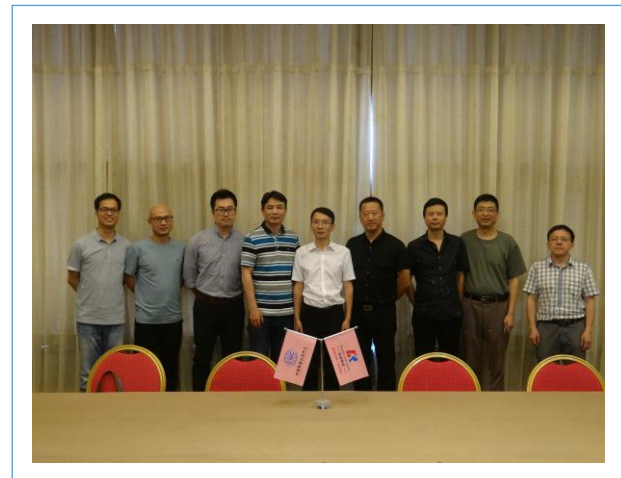
2018. 5. 16 CQC 和科润智控举行新能源研讨会