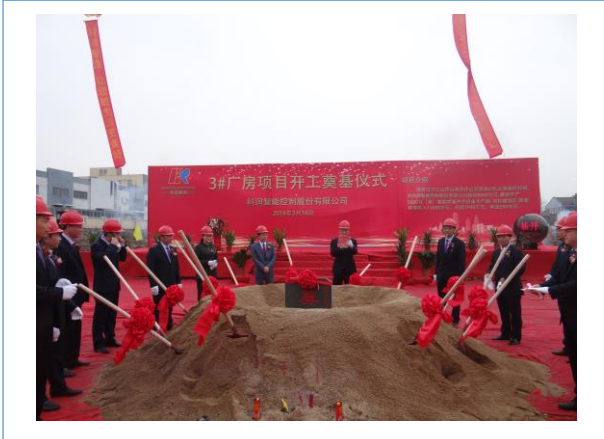
2018年3月18日，公司3号厂房奠基