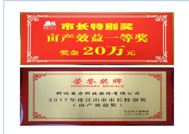
2018. 2. 23 公司荣获市长特别奖