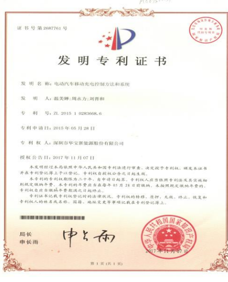
2017年11月7日取得了专利号为ZL 2015 1 0283668.6 移动电源发明专利。