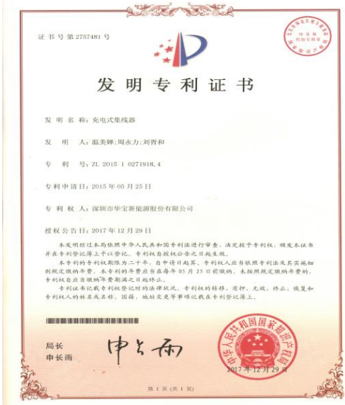
2017年12月29日取得了专利号为ZL 2015 1 027918.4 移动电源发明专利。