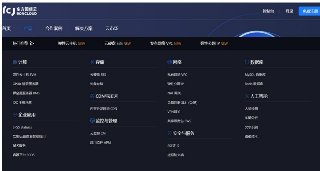
东方国信云产品矩阵

东方国信云计算业务 BONCLOUD 是依托东方国信多年的云计算技术研发和服务积累，结合优质数据中心资源，打造的云服务平台。公司结合 20 多年企业级 IT 及大数据服务经验，在工业互联网、政务、金融等企业级市场全面布局，可提供从服务器机柜租赁、裸金属到私有云、公有云、混合云等一体化、自动化、智能化的端到端交付解决方案。云业务实现全局的安全监测和预警，风险实时发现和威胁精确定位，保障系统和数据安全,专业服务上千内外部客户。