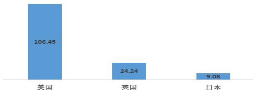
2019年全球主要国家燕麦行业市场规模分布情况（亿美元）

至 2023 年，中国燕麦片市场规模成长超过 100 亿元人民币，参照欧美发达国家燕麦行业市场规模，结合人口规模、燕麦片人均消费及中国目前燕麦片消费场景扩展趋势（热食到冷食，早餐到休闲场景等）考虑，中国燕麦片市场预计将继续增长，市场空间将进一步扩大。