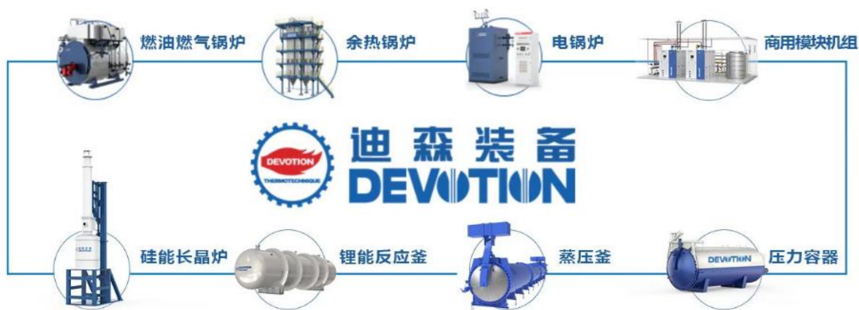
图 1：清洁能源装备系列产品

公司专注新能源及清洁能源应用装备的研发和制造，实行“以销定产”的经营模式，为客户提供新能源装备、热力、蒸汽、采暖等多样化能源装备综合解决方案。其中新能源装备产品包括光伏设备结构件（单晶炉腔体、蓝宝石炉腔体及铸锭炉腔体等）、锂电池设备；清洁能源装备产品主要有釜类容器产品系列（如蒸压釜、玻璃蒸压、热压罐、渔网釜）及锅炉产品系列（如电锅炉、余热锅炉、生物质锅炉、商用锅炉、天然气锅炉）等。公司拥有省市两级技术中心和热能工程研发中心，是《燃气采暖热水炉》、《电加热锅炉技术条件》、《蒸压釜》等多项国家及行业标准主编单位，并拥有机器人焊接生产线，全面实现数字化下料、自动化焊接、标准化装配，整个生产过程质量可控，全新设计的冷凝锅炉系列产品，可满足国家最新能效标准，最严苛超低氮排放要求，符合中国城镇化及燃气化进程，高效的分布式供热趋势及日益严格的环保标准，已广泛应用于钢铁、化工、汽车、纺织、食品、医药、酒店、学校、住宅、商业综合体蒸汽、采暖和热水供应，充分满足用户多样性、个性化需求。专业的售前、售中、售后技术支持也可全方位帮助客户发现、识别并解决供热系统的各类问题，保障系统长期稳定运行。