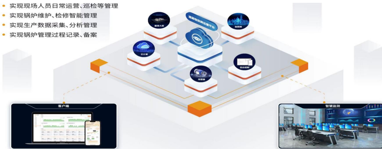
图 2：物联网运营平台