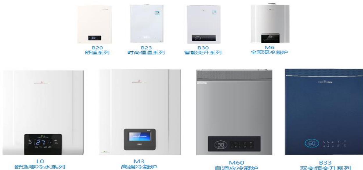
图 6：“小松鼠”壁挂炉系列产品

迪森家居基于工业物联网技术，创新融合智能舒适家居产品生态体系，结合大数据和人工智能技术，通过自动采集室内环境中的温度、湿度、新风量、洁净度、水温、水质软硬度等数据，实时反馈数据信息，实现远程控制。并可通过收集、分析用户行为数据、室内环境等自我学习，提供个性化舒适度解决方案。