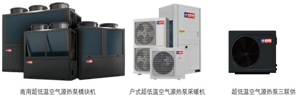
图 4：空气源热泵系列产品

公司空气源热泵采用直流变频系统，能对压缩机转速进行智能调节，实现能量输出与需求的完美匹配，利用一份电能提取 3-4 份可再生能源中的低位热能，节能效果显著。