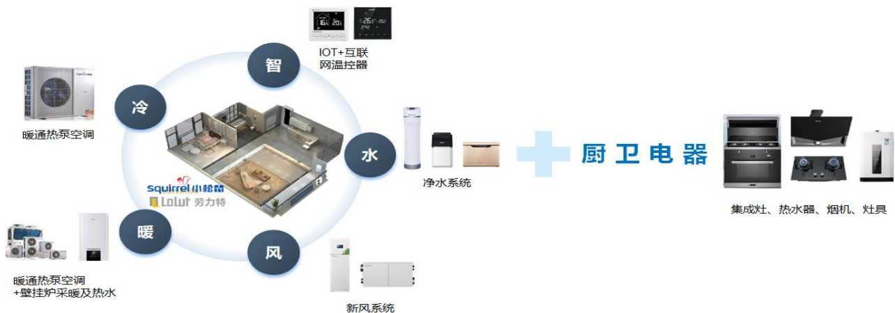
图 3: 冷暖风水智+厨卫(舒适家解决方案)

公司智能舒适家居围绕“冷、暖、风、水、智”五大元素,致力于为家庭用户提供健康、舒适、智能的家居系统解决方案。通过热泵暖通空调、壁挂炉采暖及热水、全屋新风、全屋净水四大系统进行自主平衡,智能融合舒适家居“温、湿、氧、风、洁、静”的恒适环境,为用户打造安全便捷、舒适健康、节能环保的人性化家居环境。