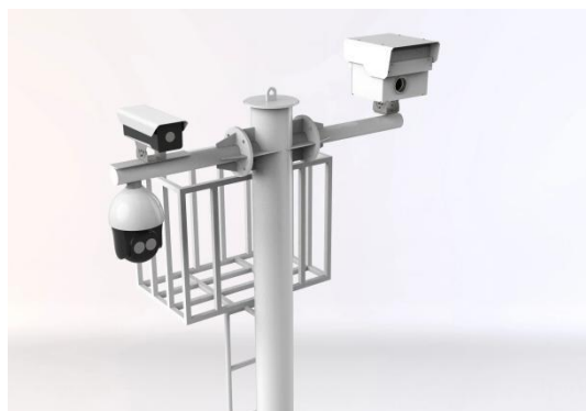
变电站预警应用·电力现场作业安全预警系统

基于三维实景的变电站作业 AI 安全预警系统 根据变电站现场作业工作票要求，将变电站作业监管区域、设备、作业行为等全息数据化，建立实景三维模型。利用远距离激光三维扫描感知设备采集作业区人员、工具、登高车辆、部件等空间点云数据和图像数据，经人工智能分析判断，实时识别预警作业区域内人员准入备案、安全帽佩戴、工作服规范穿着、跨越安全围栏、梯子搬运、工完场清、登高人员使用安全带等作业违章和不规范行为。