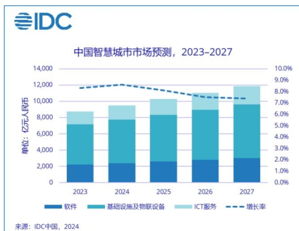
图表：IDC 对中国智慧城市市场规模的预测

ICT 市场投资规模将达到 11,858.7 亿元人民币，2023 - 2027 年的年均复合增长率（CAGR）为 8.0%。