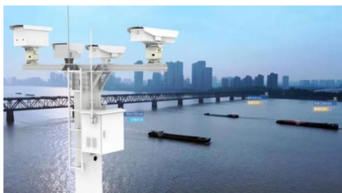
内河监管应用·水上智能卡口系统

公司充分利用三维激光扫描技术高效率、高精度的独特优势与特点，成功应用于周界安防、内河船舶监管及变电站安全防范等场景中，并形成了自有的技术创新成果，如水上智能卡口系统、桥梁安全预警系统、三维激光哨兵系统、电力现场作业安全预警系统、机场围界系统等。