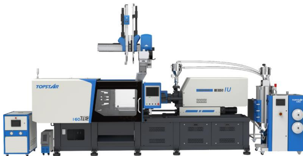
图 4：注塑领域全系列产品节选

公司主要聚焦于 TE 系列电动注塑机的产品设计及研发，专注于低碳节能的同时进一步实现精密化、智能化。公司 TE 电动注塑机产品线将更加丰富，在面对市场竞争时亦可采用更加灵活主动的销售策略，有助于公司进一步打开市场。