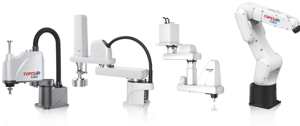
图 1：公司的多关节机器人产品节选

在六轴多关节机器人方面，报告期内新增一款机型——TRV035-1800，最大负载为 35kg，可应用于汽车、新能源、3C 等行业。