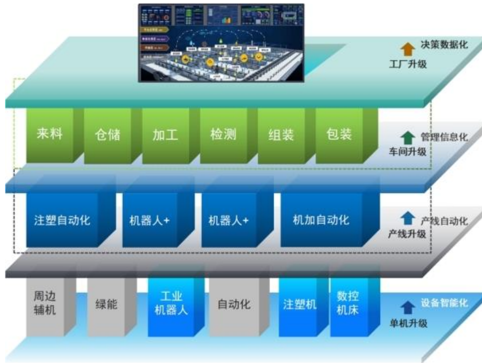
图 5：智能工厂示意图