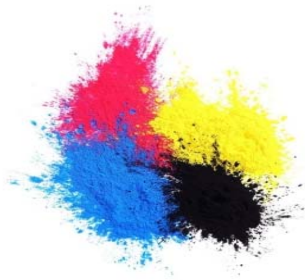
图：彩色及黑色墨粉