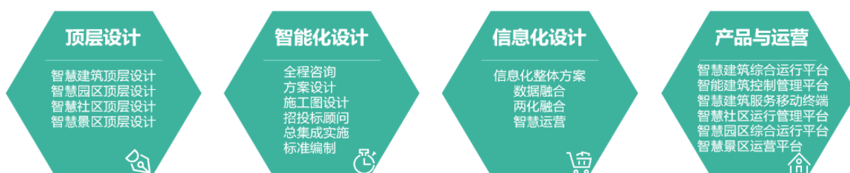
延华智慧城市与云平台业务全生命周期管理和服

在新一轮数字中国建设和 AI 赋能产业焕新的背景下，公司立足于数字技术积累，关注新技术应用，结合城市智慧大脑、智慧中台、各行业应用场景需求、数字孪生在建筑的应用，在大型城市综合体、大型公建、智慧医院、数据中心、超高层建筑、星级酒店、智慧校园、智慧社区等建筑细分领域持续发力，为城市及建筑提供从顶层设计与咨询、智能化设计、信息化设计、平台运营、改造焕新等全生命周期的解决方案；助力解决城市运营、管理，提供城市智慧运行、统一管理和精准服务等发展过程中的疑难问题，助力数字中国建设、助力企业发展新质生产力，提高城镇运营管理服务水平和人民生活幸福感，增强城镇综合竞争力。