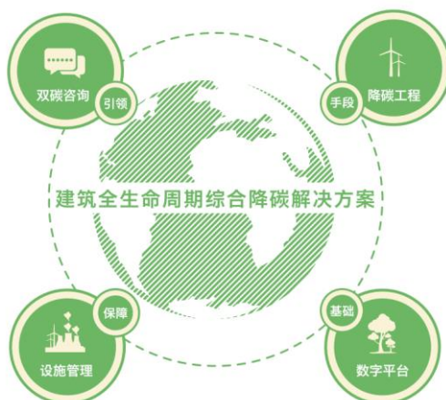
延华绿色双碳与数字能源业务全生命周期管理和服

在国家和地方各个领域“双碳”政策的加持下，节能服务产业保持快速发展态势。控股子公司东方延华公司作为上海市节能行业的头部企业，致力于将节能服务与数字化、智能化深度融合发展，围绕“安全、健康、绿色、智能”战略核心，开展双碳咨询、数字能源、降碳工程、智慧运维等建筑全生命周期的服务与运营。“双碳”背景下，低碳与数字能源版块将发力大型建筑和重点用能单位的碳资产管理服务，内容涉及碳审计、碳核算、碳纳入、碳监测、碳报告、碳交易、碳清缴等全过程的碳资产管理业务，助力双碳目标达成。