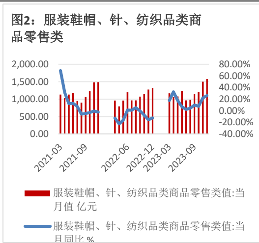
图 2：服装鞋帽、针、纺织品类商品零售类值