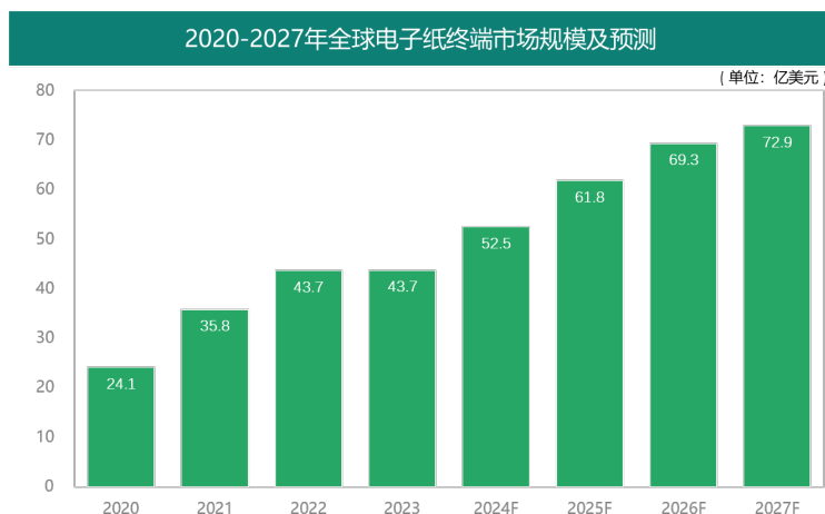
2020—2027 年全球电子纸产业终端市场规模及预测（单位：亿美元）

受全球消费疲软造成消费类电子纸市场需求下降，2023 年全球电子纸显示终端市场规模增速放缓，全年市场规模约 43.7 亿美元，与 2022 年全年市场规模基本相当，略微保持正增长。预计 2024 年随着市场回暖，商业活动恢复，全球电子纸市场规模将恢复高速增长的趋势，全球市场规模预计增长至 52.5 亿美元。