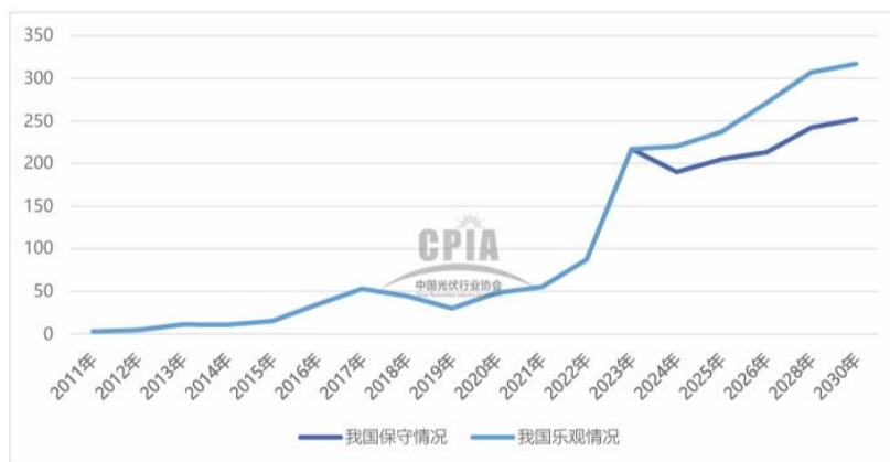
图 68 2011-2023 年国内光伏年度新增装机规模以及 2024-2030 年新增规模预测 (单位: GW)