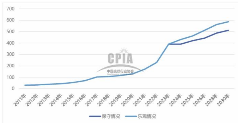
图 67 2011-2023 年全球光伏年度新增装机规模以及 2024-2030 年新增规模预测 (单位: GW)

2023 年，全球光伏新增装机超过 390GW，创历史新高。未来，在光伏发电成本持续下降和全球绿色复苏等有利因素的推动下，全球光伏新增装机仍将持续增长。2023 年 8 月，联合国大会决议，将每年的 1 月 26 日设为“国际清洁能源日”，展示了国际社会关于能源清洁低碳发展、公正包容转型的广泛共识。经过十几年的发展，光伏产业已成为我国少有的形成国际竞争优势、实现端到端自主可控、并有望率先成为高质量发展典范的战略性新兴产业。目前我国光伏产业在制造业规模、产业化技术水平、应用市场拓展、产业体系建设等方面均位居全球前列，中国在全球清洁能源发展中发挥着举足轻重的作用。