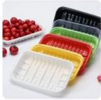
挤出板材（食品接触用产品）

公司生产的主要产品“高抗冲聚苯乙烯”具有优越的抗冲性及韧性，产品档次较高，是高附加值的环保型新材料，属于国家战略性新兴产业重点产品，具有较高的市场知名度和市场认可度，也是公司的主要利润来源。“高抗冲聚苯乙烯”广泛的应用场景如下图所示：