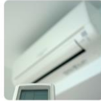
高档电器、器具外壳