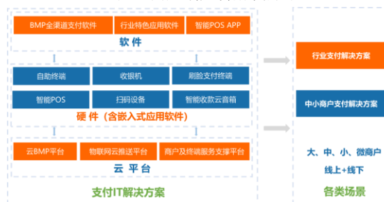
图：商户端支付解决方案

按照服务模式不同，商户规模大小，方案的个性化程度，技术实现难易程度，商户端支付解决方案分为行业支付解决方案及中小商户支付解决方案。