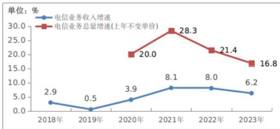
图 1 2018—2023 年电信业务收入和电信业务总量增长情况

经初步核算（注 1），2023 年电信业务收入累计完成 1.68 万亿元，比上年增长 6.2%。按照上年价格计算的电信业务总量同比增长 16.8%。