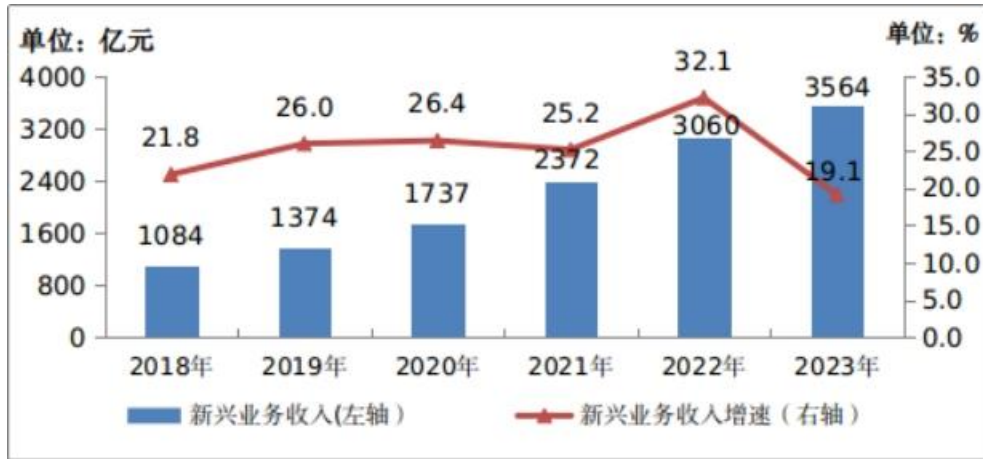
图 2 2018—2023 年新兴业务收入发展情况