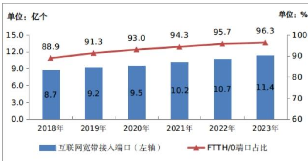
图 3 2018—2023 年互联网宽带接入端口发展情况

2023 年，新建光缆线路长度 473.8 万公里，全国光缆线路总长度达 6432 万公里；其中，长途光缆线路、本地网中继光缆线路和接入网光缆线路长度分别达 114 万、2310 万和 4008 万公里。截至 2023 年底，互联网宽带接入端口数达到 11.36 亿个，比上年末净增 6486 万个。其中，光纤接入（FTTH/O）端口达到 10.94 亿个，比上年末净增 6915 万个，占比由上年末的 95.7% 提升至 96.3%。截至 2023 年底，具备千兆网络服务能力的 10G PON 端口数达 2302 万个，比上年末净增 779.2 万个。