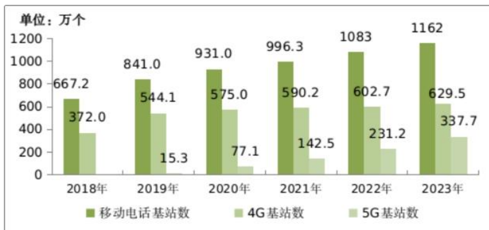
图 4 2018—2023 年移动电话基站发展情况