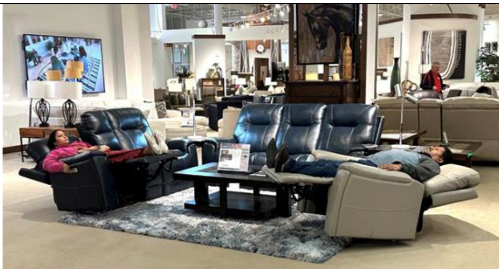
MOTOMOTION FASHION-FORWARD-FURNITURE 当地时间2023年11月16日在客户的家具零售店拍摄的匠心产品

自 2023 年 4 月高点展会第一次推出 MotoLiving 系列产品，公司在美国市场上的定位进一步得到提高，形象进一步得到改善。全新 MotoLiving 的产品，不仅凸显了更好看的外观、使用了更好的材料，而且增加了创新的功能及性能。