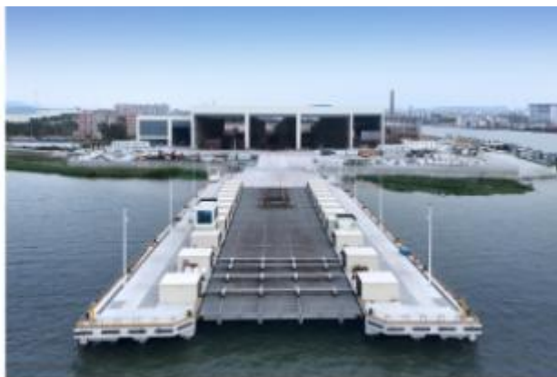
2000吨垂直卷扬式升船机