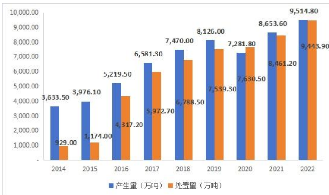
2014~2022 年我国工业危险废物产生量与处置量情况

受日益增长的市场需求和多项支持性政策共同影响，近年来，我国危险废物处置行业迅速发展，危险废物处置量增速明显高于产生量。2014 年-2022 年，我国工业危险废物处置量年复合增长率为 33.63%。2022 年，我国工业危险废物处置量为 9,443.90 万吨。