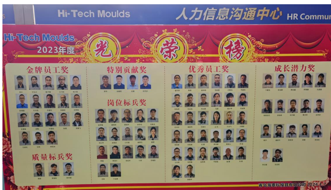
2023 年度公司表彰光荣榜