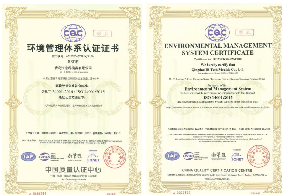
公司 ISO 14001 体系证书

为严格遵守法律法规包括《中华人民共和国环境保护法》及相关法规，本公司制定了《质量、环境、职业健康安全管理体系手册》、《资源、能源管理程序》，建立了符合 ISO14001 标准的环境管理体系，有效减少了生产及经营活动带来的污染物排放和资源消耗。本公司于 2017 年 11 月 22 日已取得 ISO14001 环境管理体系认证证书，并于 2023 年 11 月 10 日通过再认证取得新证书，有效期至 2026 年 11 月 21 日。