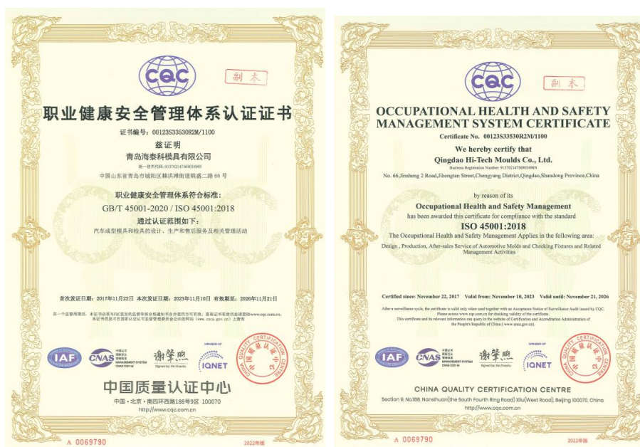
公司 ISO 45001 体系证书

ISO45001 标准的职业健康安全管理体系，保护员工职业健康安全。本公司于 2017 年 11 月 22 日已取得 OHSAS 18001 职业健康安全管理体系认证证书，并于 2023 年 11 月 10 日通过再认证取得 ISO45001 职业健康安全管理体系新证书，有效期至 2026 年 11 月 21 日。公司按照相关法律法规要求为员工配备安全防护用品，公司每年组织员工进行医疗健康检查及职业健康体检活动。