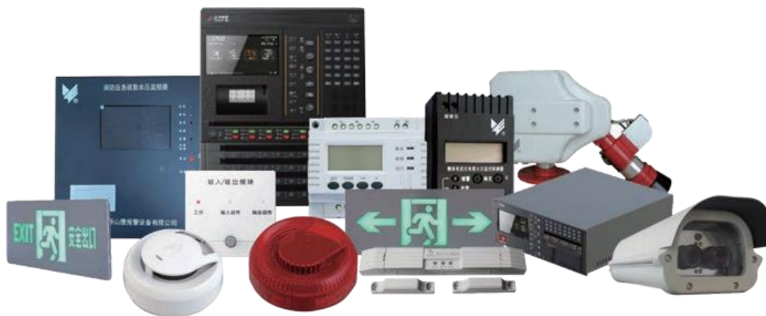
消防报警装备示意图

消防报警装备依托于全资子公司山鹰报警，主要产品有火灾自动报警系统、智能应急照明和疏散指示系统、防火门监控系统、电气火灾监控系统、消防电源监控系统、图像型火灾探测系统、自动跟踪定位射流灭火系统、家用火灾报警系统、余压监控系统、智能防排烟系统、智能消防巡检机器人、集成电池箱火灾防控系统、储能电站、智慧消防物联网平台等 14 个系列 511 种型号，并提供典型行业应用解决方案。