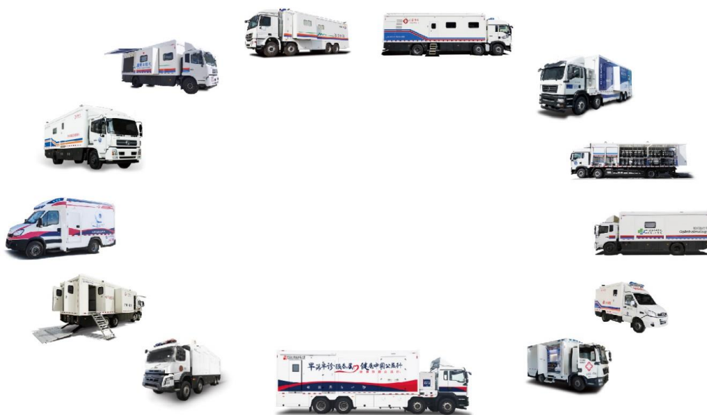
移动医疗保障装备示意图

公司已具有配置全科甲级移动医疗和医疗应急处置能力，产品也正在向高端智能方向发展，能够提供整套移动医疗应急救援保障方案，目前也是全国移动医疗保障装备最齐全的制造商。