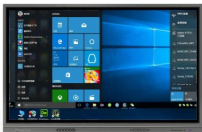
交互式白板一体机

IOT 智能显示终端产品：产品集成计算能力、多点触控、网络连接、音视频采集能力于一体的设计，可在家庭、办公、商业、教育、车载显示及医疗等多领域广泛应用。