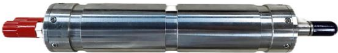
图 5：HK-AS007 数字水听器

2、声纳系统方向，公司的某型前视避碰声纳系统已于 2023 年度完成国产化适配和相关定型试验，转入批量生产阶段，并开始交付客户；2024 年度，公司将根据在手订单情况，组织好该系统的生产、试验、交付等工作，预计该系统订单量将稳步增长。2023 年，公司中标的某智能声纳项目已完成关键技术验证及样机研制，预计于 2024 年交付验收，后续将进一步拓展市场。2023 年，公司的某型声纳湿端采集系统已完成样机研制并交付验收，现已进入批量生产阶段。此外，公司的声纳系统配套类产品，如数字水听器、自容式水听器、高频采集和发射模块、水声跨域通信模块等均已完成研制并交付。