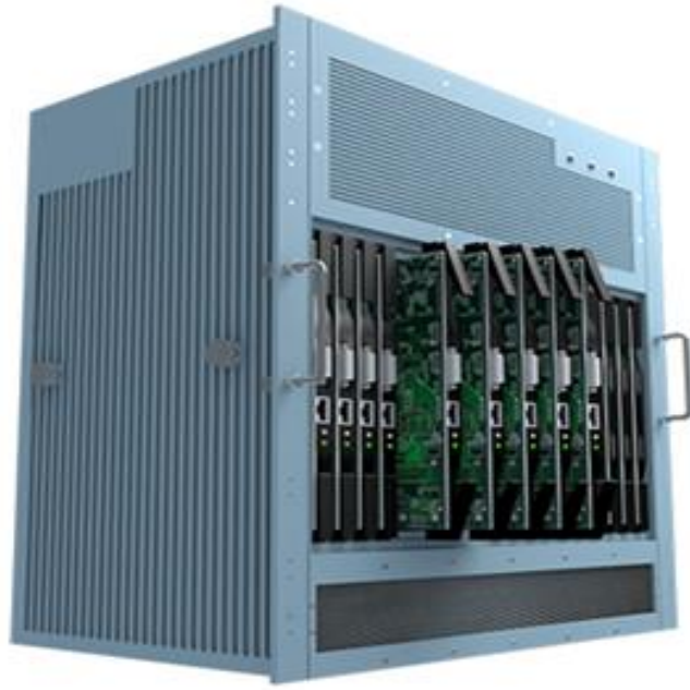
图 1：国产化信号处理机