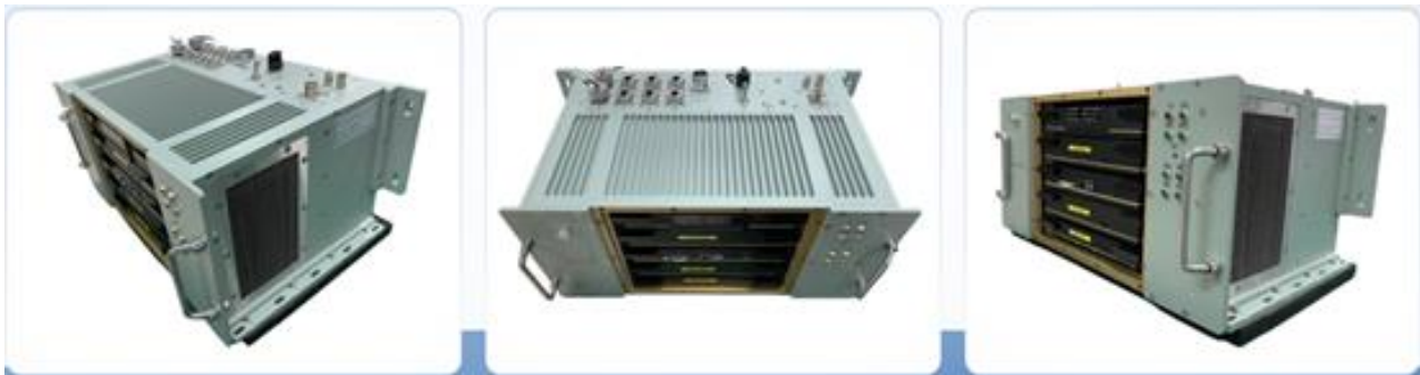
图 3：GPU 芯片的高性能计算平台