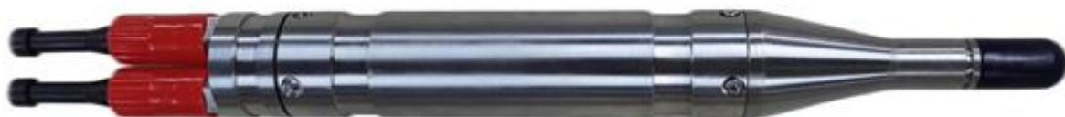
图 6：HK-BAS007 自容式水听器

3、水声大数据方向，公司 2023 年在水声大数据方向取得了重大进展。2022 年中标的两型水声大数据采集系统试点建设项目的研制、批量生产及交付，为公司的水声大数据业务奠定了坚实的基础；2023 年，公司布局多年的两型数据装备成功完成转化落地，中标总金额近亿元，公司正在组织生产和交付。