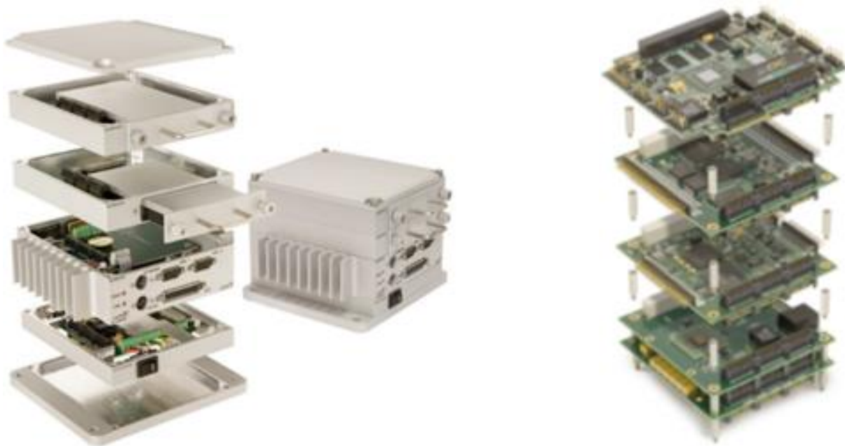
图 4：分布式高性能计算模块

2、声纳系统方向，公司的某型前视避碰声纳系统已于 2023 年度完成国产化适配和相关定型试验，转入批量生产阶段，并开始交付客户；2024 年度，公司将根据在手订单情况，组织好该系统的生产、试验、交付等工作，预计该系统订单量将稳步增长。2023 年，公司中标的某智能声纳项目已完成关键技术验证及样机研制，预计于 2024 年交付验收，后续将进一步拓展市场。2023 年，公司的某型声纳湿端采集系统已完成样机研制并交付验收，现已进入批量生产阶段。此外，公司的声纳系统配套类产品，如数字水听器、自容式水听器、高频采集和发射模块、水声跨域通信模块等均已完成研制并交付。