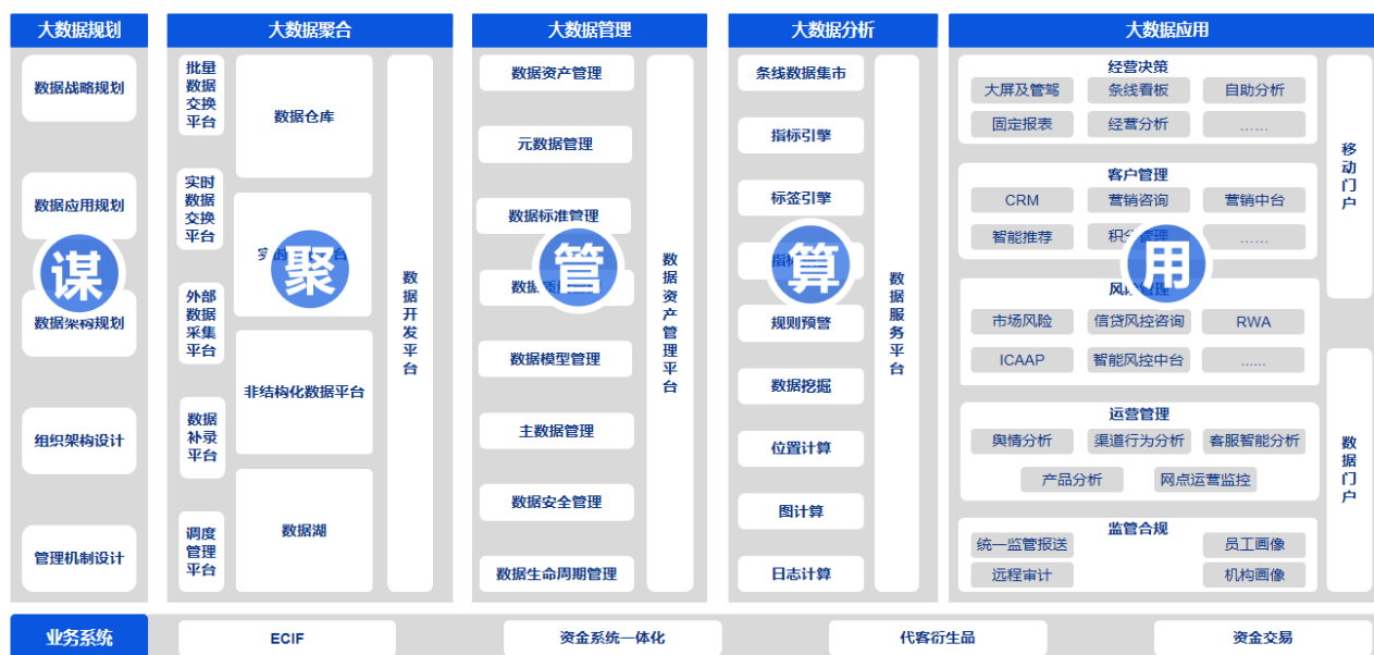
数据管理应用体系总体框架

报告期内，公司大数据业务条线积极响应国家强化数字创新要求，持续产品创新，助力金融机构深化数字化转型。公司打造了“星云数智一体化开发平台”，平台采用 DataOps 理念，将敏捷、精益等理念融入数据开发过程，打破协作壁垒，构建集开发、治理、运营于一体的自动化数据流水线，不断提高数据产品交付效率与质量。此外，公司推出了“资本新规计量管理解决方案”，该方案响应《商业银行资本管理办法》新规要求，进一步完善商业银行资本监管规则，推动银行强化风险管理水平，提升服务实体经济质效。同时，公司构建了监管报送产品“一表通”，包括报送区和可信区两大部分，同时完全满足最新试行的《银行一表通监管数据采集接口标准（2.0 试用版）》报送要求，满足报送规范性、及时性、灵活性、高性能和基础环境建设等监管要求。其它产品包括数据资产管理平台、指标管理平台、标签管理平台、资金及资本市场系统等产品持续迭代升级，从信创适配、微服务架构升级、产品功能优化等方面完善产品，打造更安全、稳定、流畅的产品系。