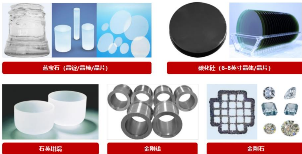
图五 公司材料业务产品

公司基于多年的晶体材料生长及加工技术和工艺积累，在泛半导体领域积极布局新材料业务。使用自主研发的材料制备及加工设备，通过技术和工艺创新，打造高品质材料核心竞争力，逐步发展了高纯石英坩埚、蓝宝石材料、碳化硅材料、以及金刚线等具有广阔应用场景的材料业务。