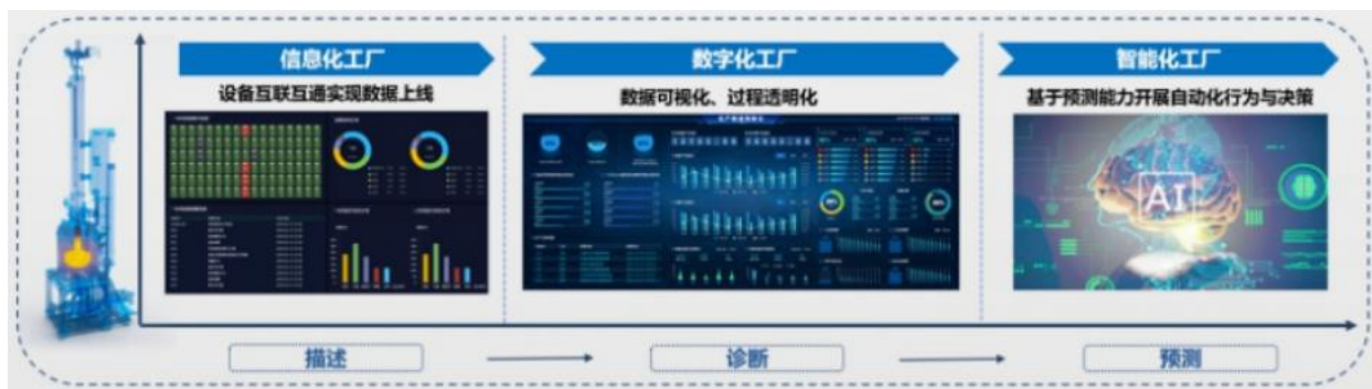
图四 公司智能化解决方案

同时，以材料生产及加工装备链为主线，通过实现各装备间的数字化和智能化联通，向客户提供自动化+数字化+AI大数据的解决方案，促进客户生产效率提升；