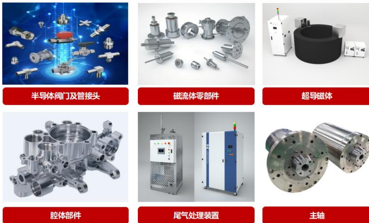
图六 公司精密零部件