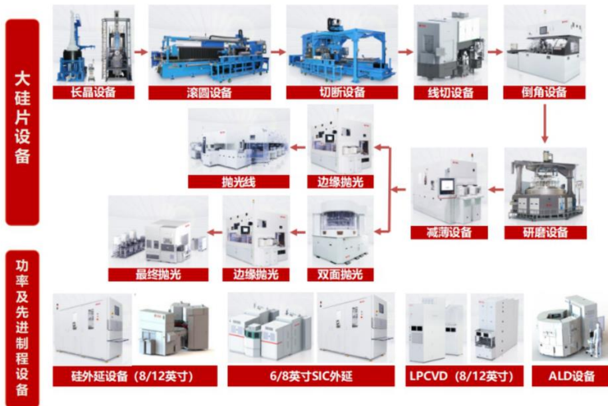
图二 公司半导体装备产品