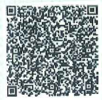
岑敬的年检二维码

本证书经检验合格，继续有效一年。 This certificate is valid for another year after this renewal.