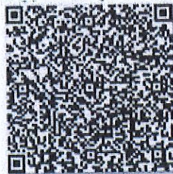
黄晓女的年检二维码

本证书经检验合格，继续有效一年。 This certificate is valid for another year after