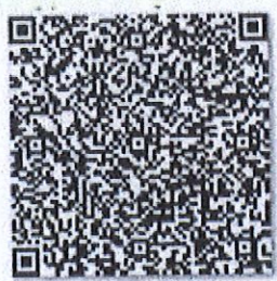
真别置的年检二维码

本证书经检验合格，继续有效一年。 This certificate is valid for another year after