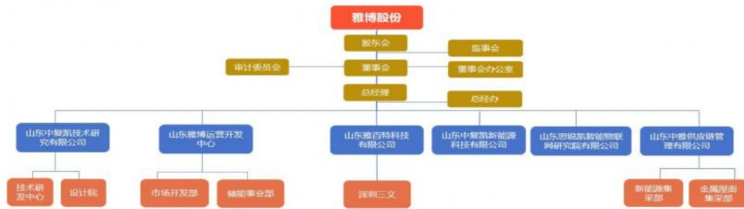
雅博股份最新组织架构图 2023-09