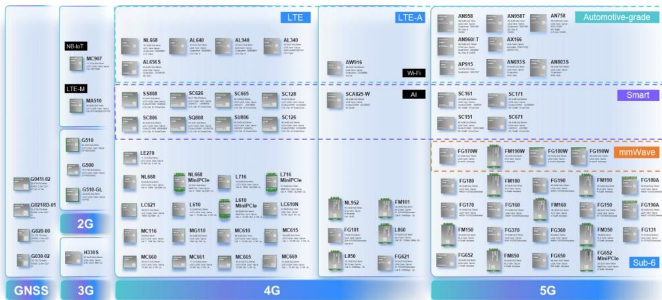
图 2：公司主要产品图片

公司主要产品包括 2G、3G、4G、5G、NB-IOT 的无线通信模块以及基于其行业应用的通信解决方案，通过集成到各类物联网设备使其实现数据的互联互通和智能化，报告期内公司产品广泛应用于车联网、无线网联设备、移动办公、智慧零售、智慧能源、智慧安防、工业互联、智慧城市、共享经济、远程医疗等数字化转型的行业。近两年，公司主营业务未发生重大变化。