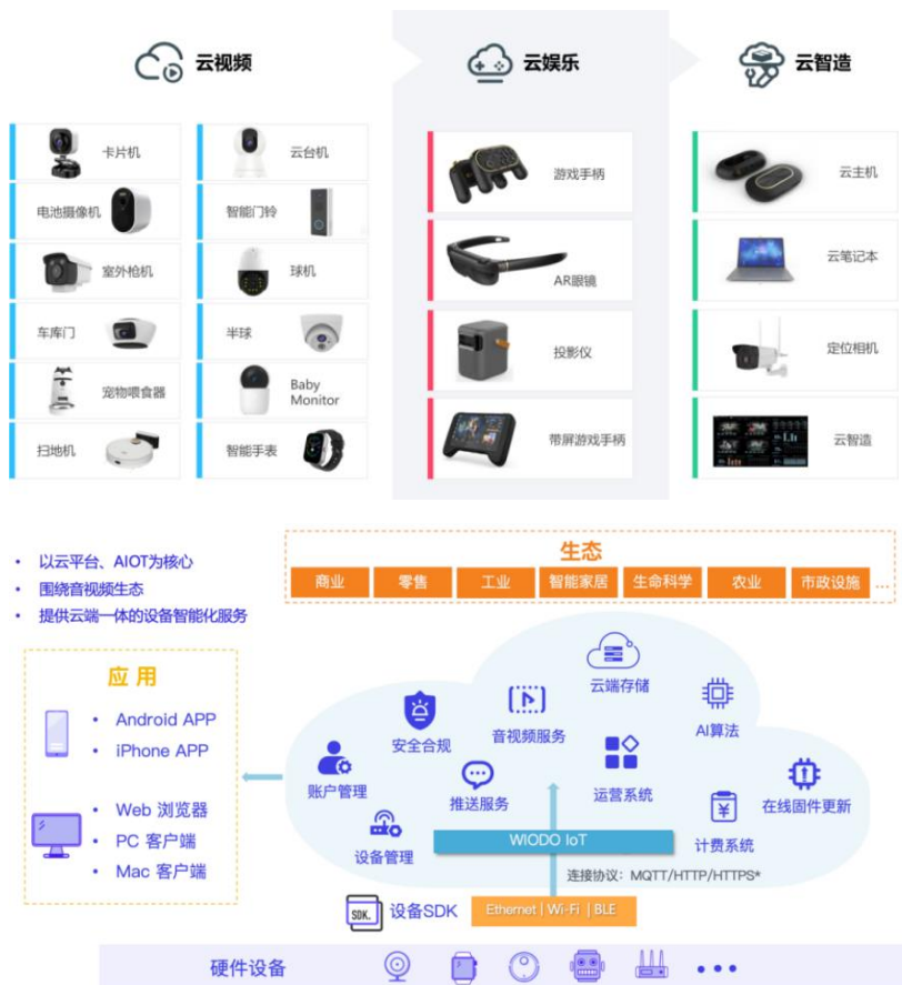
图：协创云生态构建

及车联网智能终端等。云平台方面，面向消费级用户，提供以视觉交互为主的智能安防解决方案；面向行业类客户，提供用于管理物联网设备的开放式云平台服务。物联网智能终端具备数据信息采集、运算分析、存储和网络传输能力，通过设备端的边缘计算能力和云端的运算，可实现智能感知、交互、大数据服务等功能。在大健康领域，公司推出了智能健康穿戴硬件，通过传感器采集基础数据、以精准算法为用户展现运动和身体指标状况。