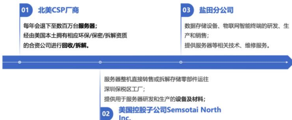
图：服务器再制造业务流程

服务器再制造业务方面，公司控股子公司 Semsotai North Inc. 在北美开展服务器的回收、拆解，并经由协创数据深圳盐田分公司和协创数据保税区分公司对由 Semsotai North Inc. 购买设备及材料用于服务器的研发、生产和销售，并提供服务器等相关技术、维修服务等。