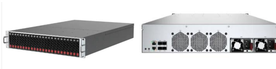
1、图：刀片式 ARM 服务器

机械硬盘、消费级固态硬盘和工业级固态硬盘及 AI 云服务器等。存储设备是将信息数字化后，再利用电、磁或光学等方式的媒体加以存储的设备。AIGC 时代，数据量井喷式增长，越来越多的信息转变为数据进行存储和处理，数据的重要性和价值越来越高，为数据存储行业带来前所未有的挑战与机遇。集团在 SSD 产品上具备完整的产品线。公司推出的企业级 SSD 具备高速运算的性能、更好的可靠性、更大的单盘容量以及更高的使用寿命，可以适应 AI 时代对高性能存储设备的要求。