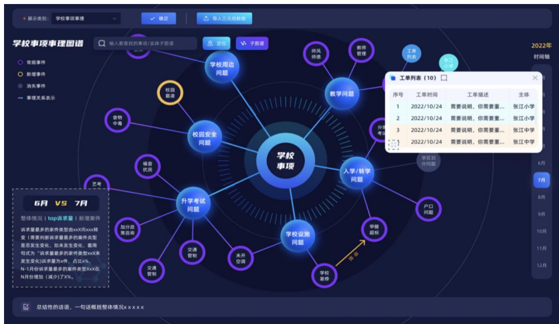
图 3 现有知识图谱应用示例图（公司内部应用）

知识图谱涉及实体/事件表示、事件/实体关系、事件/实体类型等大量内容和关系节点，能够很好的表达主体/事件的发生、发展及关联影响信息。但在使用过程中，一是客户的业务数据多为非标数据，与知识图谱的直接应用间仍然存在着落地差距；二是即使公司产品包含了对业务数据的清洗加工，客户仍缺少专业知识来实现数据提取、图谱对标和推理应用。这就导致目前“知识智谱”项目产出主要应用于公司内部的咨询业务支持，或作为底层能力支撑部分数智化产品的展示推理，很难作为核心模块形成独立产品向市场交付。下图展示了当前知识图谱在内部咨询团队的应用展示形式，需要专业数据人员与业务人员共同参与才能进行应用。