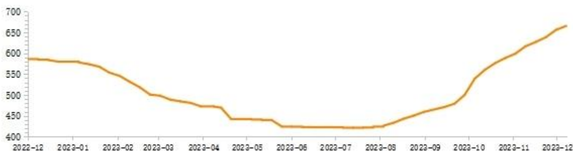
2023 年 NAND 价格指数变动情况

根据 CFM 闪存市场数据，NAND Flash 价格指数在 2022、2023 年上半年下跌调整后，走势逐步趋于平缓，并于 2023 年三季度逐步开始反弹。截至 2024 年 1 月 2 日，NAND Flash 价格指数较 2023 年最低点上涨 57.82%，较年初上涨 13.83%。据分析机构 CFM 统计，三季度三星 NAND Flash 销售收入为 29.60 亿美元，环比增长 7.5%；SK 海力士（包括 Solidigm）NAND Flash 销售收入为 18.84 亿美元，环比增长 13%；西部数据 NAND Flash 销售收入为 15.56 亿美元，环比增长 13%。NAND 芯片价格虽已止跌回升，但目前报价仍与三星、铠侠、SK 海力士、美光等供应商的盈亏平衡点有一段差距。