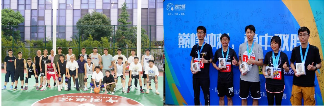
丰富多彩的员工活动

公司还特别重视员工的文化生活，员工在工作之余也能参加丰富多彩的文化活动。公司有阅览室、读书角等学习文化角，会为员工提供各类图书阅读、学习，同时，我们也会定期更新各类书籍和杂志，让员工持续学习、持续成长，变成更好的自己。