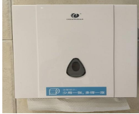
节约用水、用电、用纸宣传标识