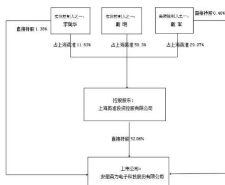
公司与实控人之间产权及控制关系的方框图