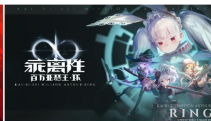
乖离性百万亚瑟王：环