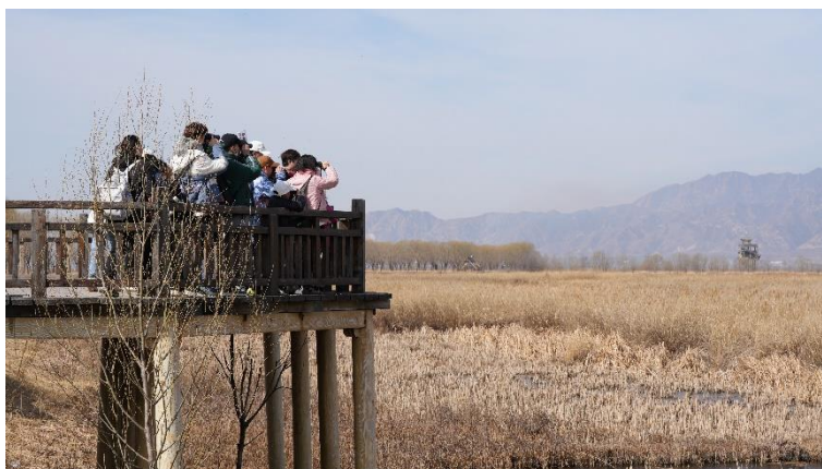
图为 2023 年完美世界“自然与我 完美同行”野鸭湖观鸟活动

2023 年 3 月，完美世界工会联合会组织员工前往北京野鸭湖湿地，邀请专业讲师为员工讲解鸟类与湿地生态的生命渊源等科学知识，并指导员工开展实地观鸟活动。此活动通过参与观察和记录鸟类在湿地中的数量和种类，帮助员工了解生物群落的生态环境和生物多样性，提高员工对湿地生态问题的认知和关注，促进人与自然和谐共生。