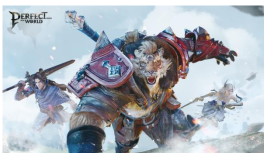
Perfect New World