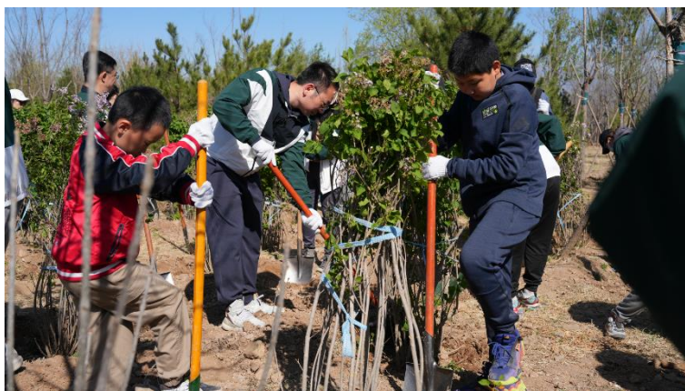
图为 2023 年完美世界“植得·完美”员工志愿植树活动

2023 年 4 月，完美世界工会联合会组织近百名员工再次来到八达岭碳汇示范林基地开展“植得·完美”系列植树活动。在专业人员的指导下，员工亲身参与铲土造坑、培土围堰、提水浇灌，有条不紊地完成每道种植工序。除了种树，员工还参与学习树木抚育技术要领和注意事项，按照“整齐划一、外型美观、利于生长”的原则，用锯条对林场内侧柏上的枯枝、过密枝进行“美容”修剪，让树木焕发新颜，以身体力行的方式，推动人与自然和谐发展，厚植绿色希望，绘就美好生态画卷。