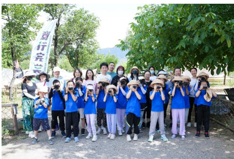
图为 2023 年完美世界“童行·完美”生物多样性主题活动

2023 年 5 月，完美世界工会联合会组织近百名员工及其子女结合六一儿童节开展“童行·完美”生物多样性主题活动，通过专业自然讲师的讲解与科普，员工及其子女亲身参与在大自然间用影像捕捉生命的律动、在夜间用手电筒探索灵动的生物、用废弃物品制作环保相框等趣味活动，引导员工及其子女与大自然亲密接触，唤起他们热爱自然、保护生物多样性、绿色低碳生活的意识，正确倡导社会公众尊重自然、顺应自然、保护自然。