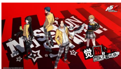
女神异闻录：夜幕魅影