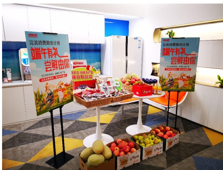
图为完美世界在公司内茶水间设置的消费帮扶“暖心驿站”

2023 年，完美世界工会联合会结合端午佳节员工活动，以“消费帮扶、以购代捐”的方式，从内蒙古、新疆等地区，采购当地百姓生产的农副产品，共计 165,847 元，通过在公司设置“暖心驿站”，免费为员工提供端午尝鲜活动，以此助力当地巩固拓展脱贫攻坚成果与乡村振兴有效衔接，助推当地农民增收致富。