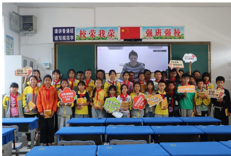
图为 2023 年“有爱才完美-线上阅读营”完美世界员工讲师与云南学校学生的结业合影

截至 2023 年 8 月，已开展了 8 期线上阅读营课程。参与阅读营课程的孩子们，也从读不下去一本完整书籍，变得慢慢发现了读书的魅力。