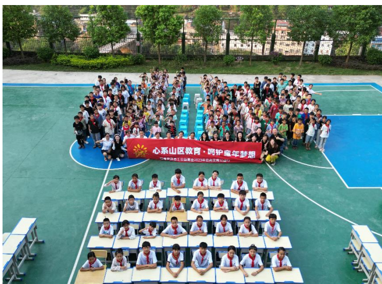
图为 2023 年“心系山区教育 呵护童年梦想”完美世界员工公益支教行活动

2023 年 5 月，完美世界组织 10 名志愿者前往云南开展第 9 届员工志愿支教活动，为当地学生教授科学魔方、美术绘画、英语、法律知识普及等课程，并邀请国家二级心理咨询师根据云南学校教师所要面对的特殊学生状况，通过具有针对性的心理课程，帮助教师们提高面对突发事件的应急反应能力，以及压力管理与心理复原能力，指导教师用正确的方式为处在逆反时期的学生提供恰当的心理引导。